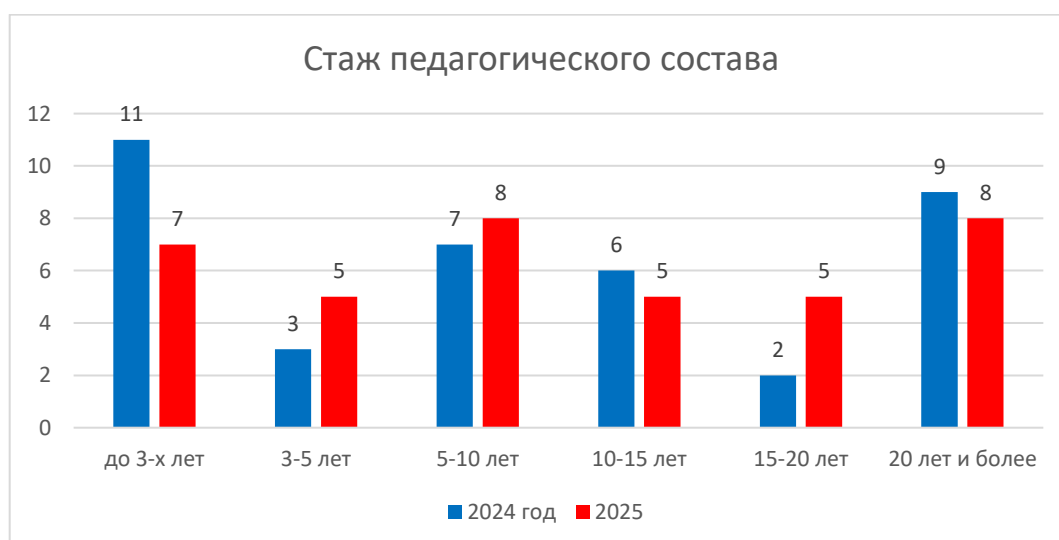
Рисунок 3. Стаж педагогического состава

В рамках года «Педагога и наставника» усилилась работа по данному направлению. Наставнические пары проводили совместные образовательные события, учувствовали в муниципальных методических объединениях представляя различный опыт, проводили родительские собрания в формате киноклуба, посещали занятия друг друга.