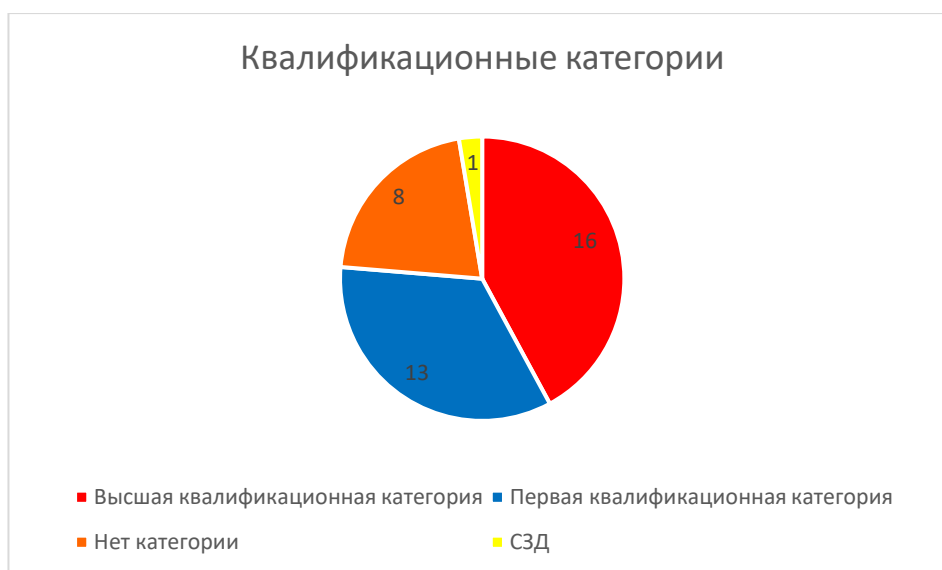
Рисунок 1. Квалификационные категории

За 2025 год педагогические работники прошли аттестацию и получили: